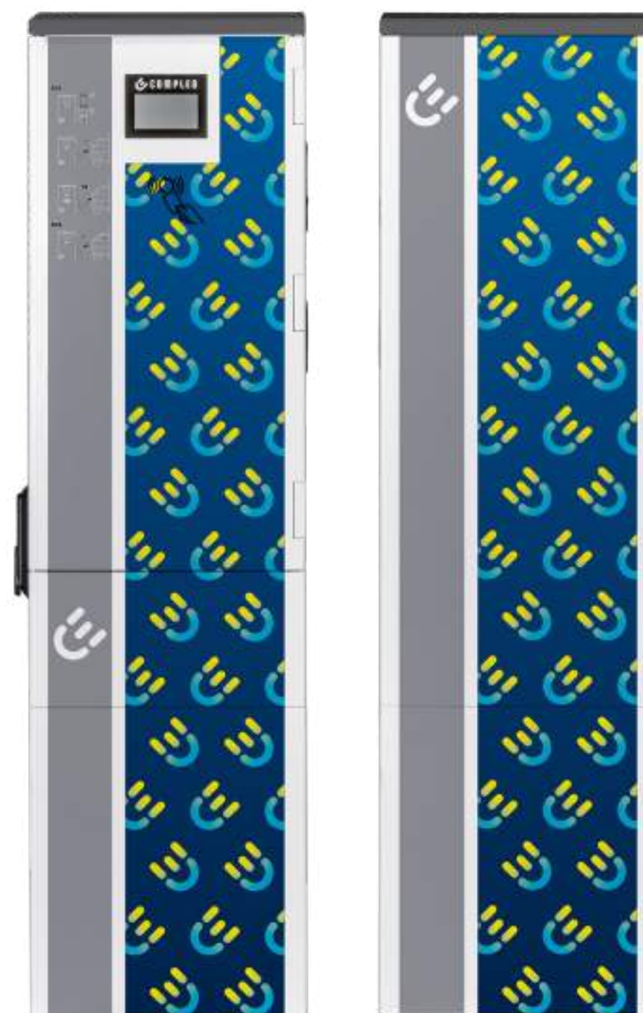
2 Folierung in freiem Bereich